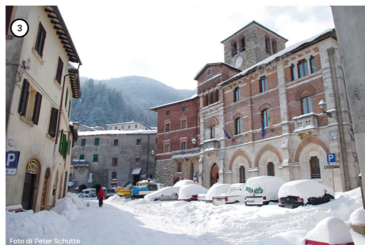
Montieri innevato. Snowy Montieri