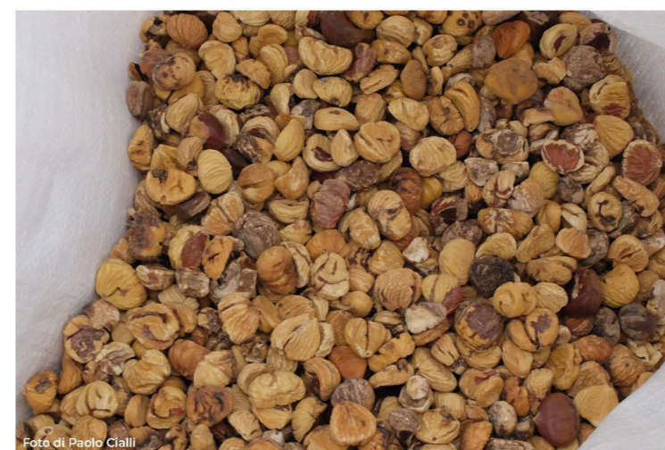
Castagne, prodotto tipico locale. Chestnuts, typical local product.