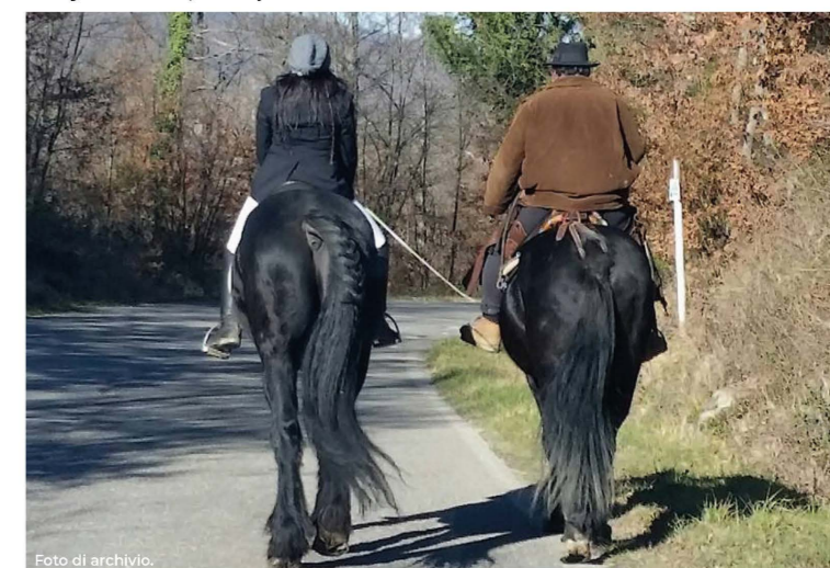
Tradizioni e turismo equestre. Traditions and horse riding tourism.