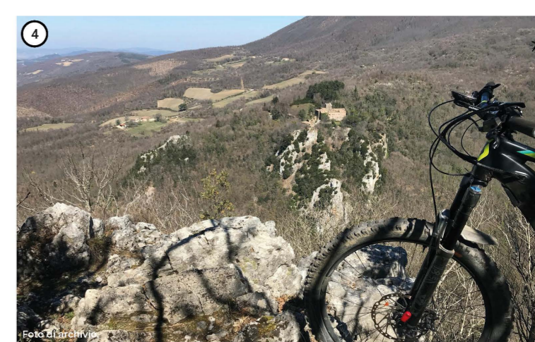
Cicloturismo in natura, particolare del castello di Fosini. Riding in the nature, detail of Fosini's castle.