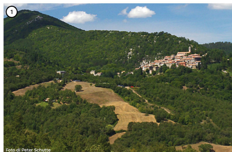
Riserva Naturale Regionale del Parco delle Cornate e Fosini. Natural Regional Reservoir of Le Cornate and Fosini.