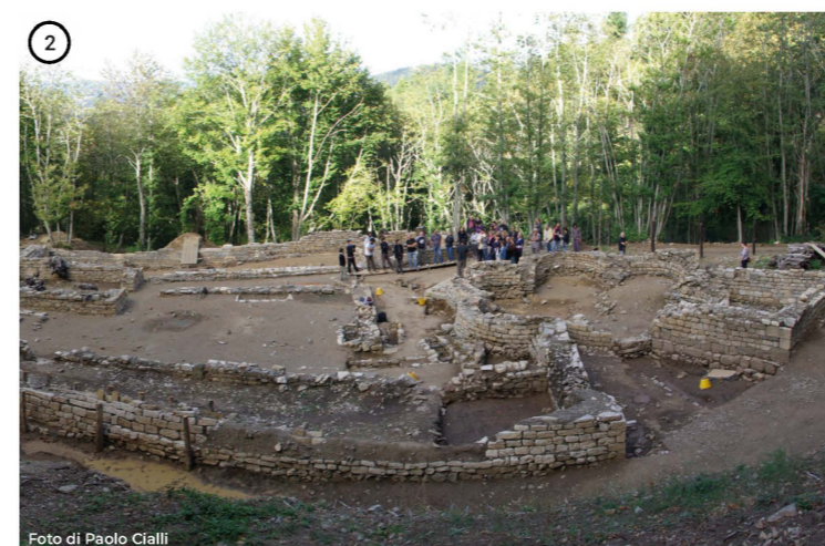
Canonica di San Niccolò. Church of San Niccolò.