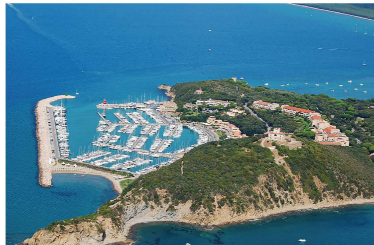
Il porto di Punta Ala. Punta Ala's harbour.