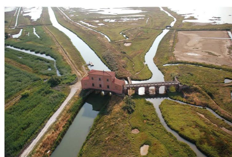
Sinistra: Castiglione della Pescaia. Sopra: Casa Rossa Ximenes (Riserva Naturale Diaccia Botrona). Sotto: le Rocchette.