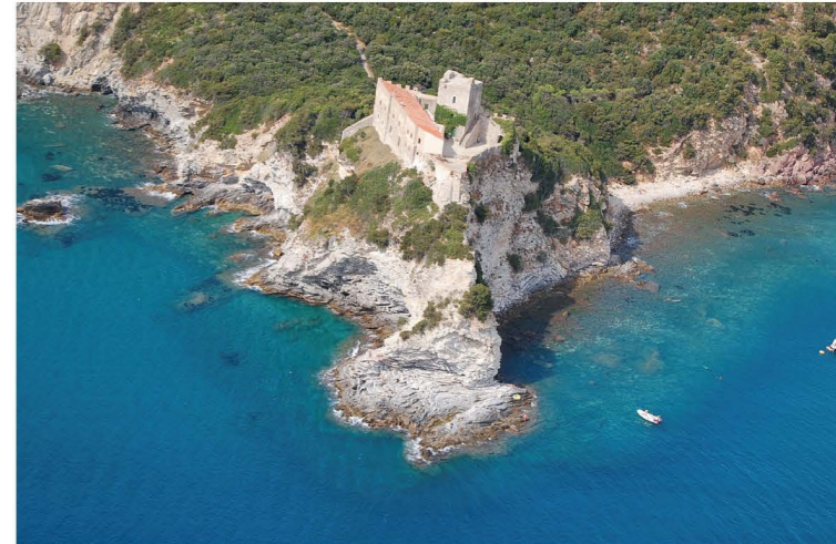
Left: Castiglione della Pescaia. Above: Casa Rossa Ximenes (natural reservoir of Diaccia Botrona). Below: Rocchette.